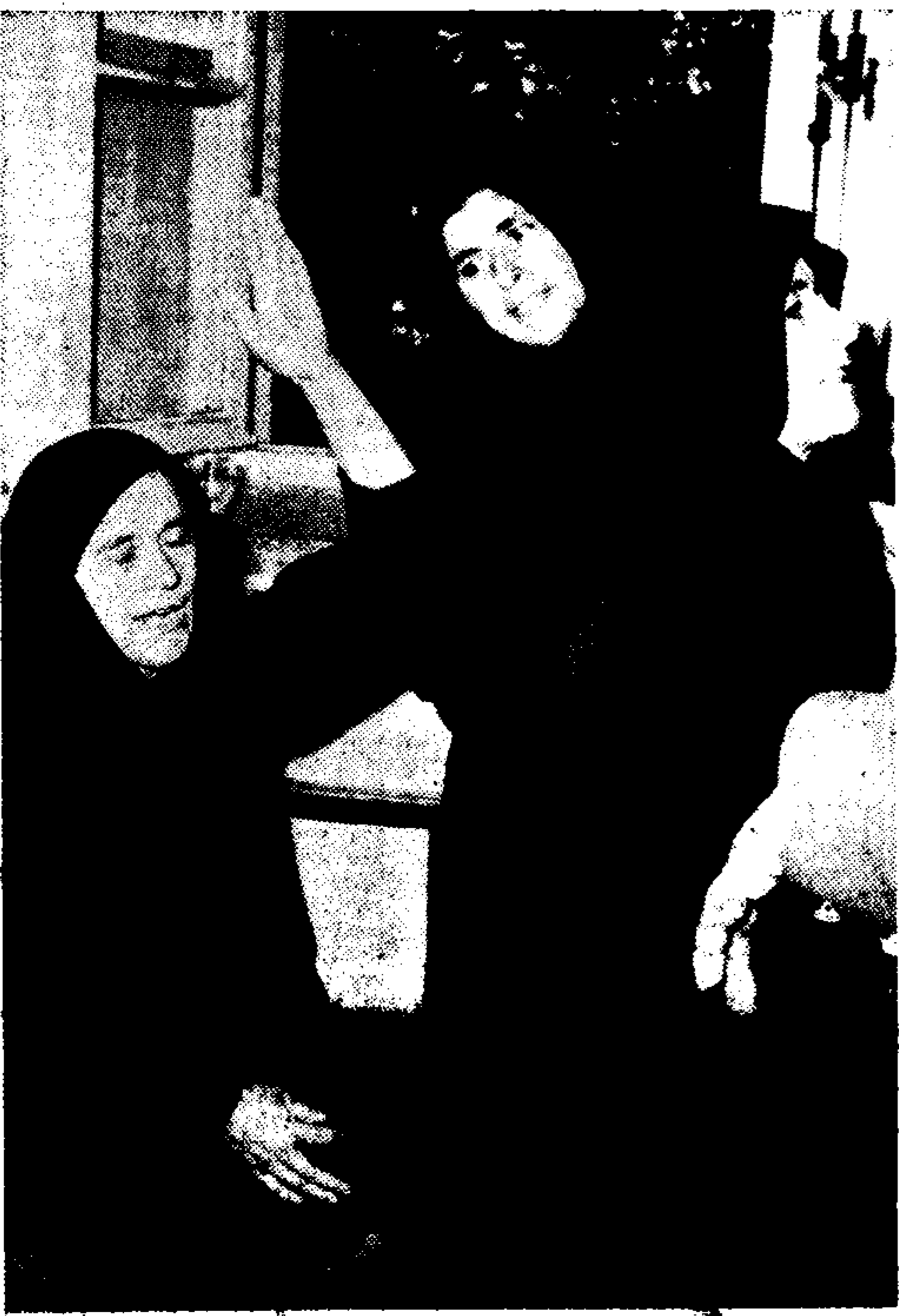
Χαρακομένες μάνες, στὸ δικαστήριον τῶν Χανίων, χθές. Εἰκόνας ποὺ θύμιζαν χορὸ ἀρχαίας τραγωδίας.